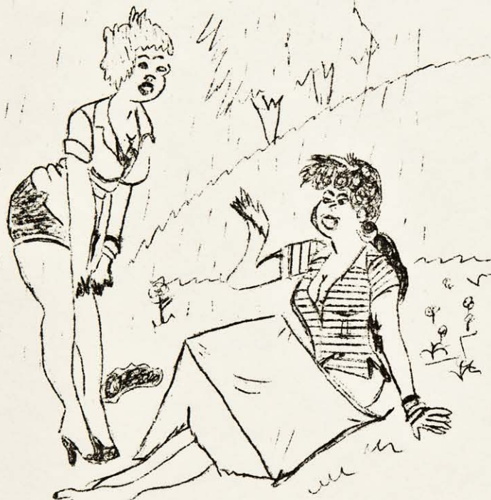
¿Ves lo que pasa por comprar cosas baratas? En cuanto llueve un poco se encoge