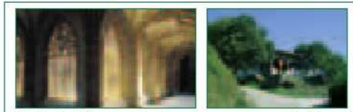
Santa Maria elizako klostroa

Deban bidea itsasoaren mailan dago, 485 metrora iristen da gero eta Markina-Xemeinen, azkenik, 94 metrora jaisten da.