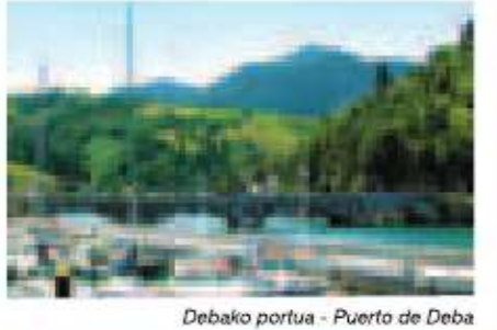
Debako portua - Puerto de Deba