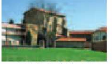
Ziortzako Kolejiata - Colegiata de Cenaruzza

BIDEAREN SEINALEZTAPENA SEÑALIZACIÓN DEL CAMINO