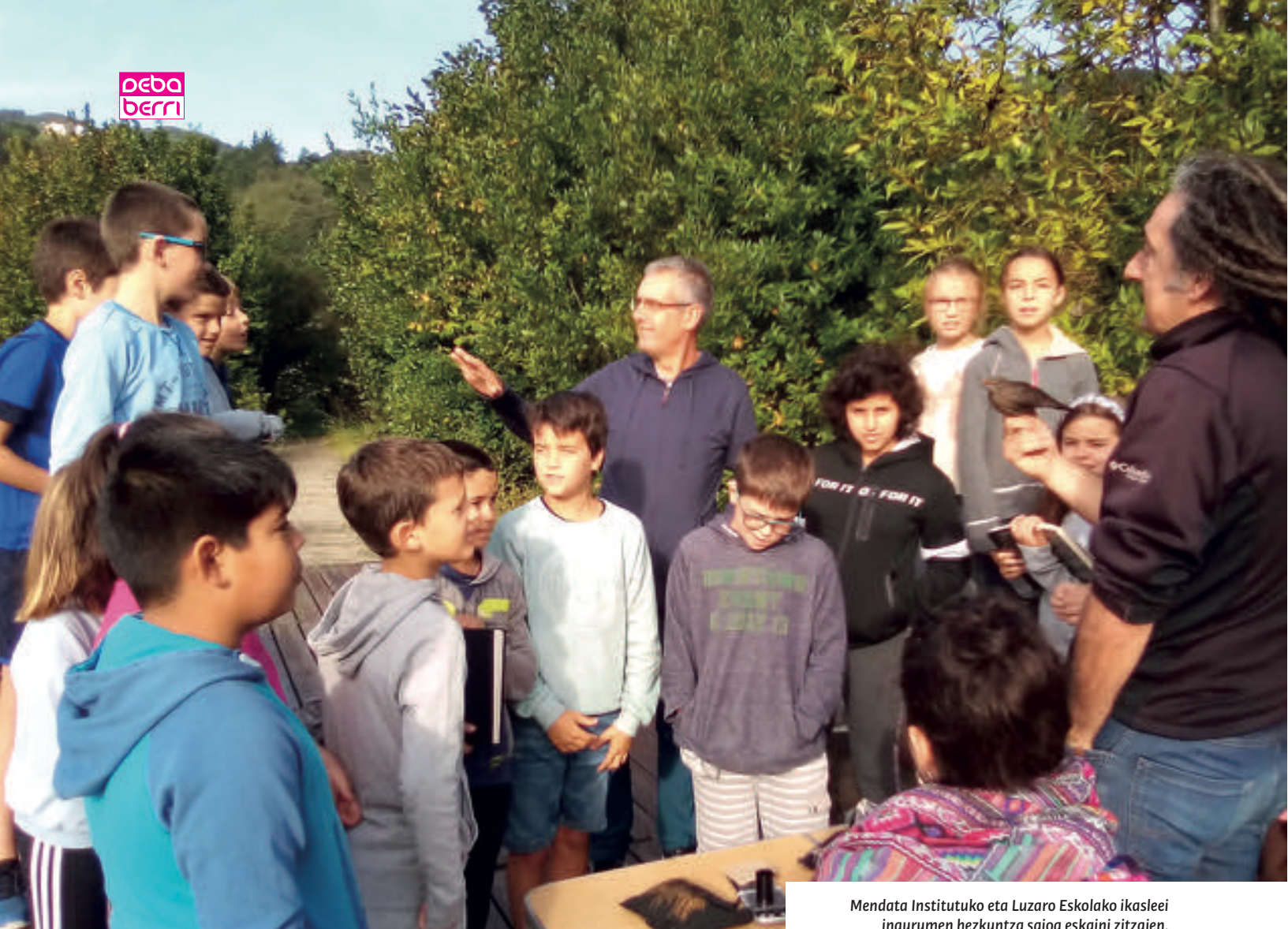
Mendata Institutuko eta Luzaro Eskolako ikasleei ingurumen hezkuntza saioa eskaini zitzaien.