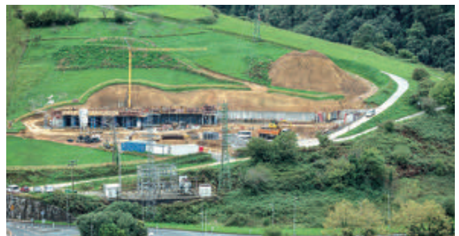
Epe laburrean amaituko dira Artzabaleko hilerriko lanak. (Argazkia: Aritz Loiola).

“Gobernu taldeak Ura Agentziarekin egindako hainbat harremanek eta honek egindako eskaerak betez, lortu da azken honek aldeko txostenak egitea”