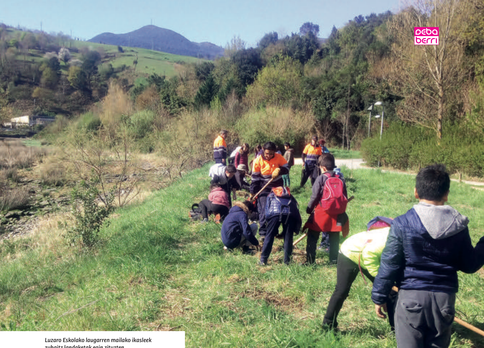
Luzaro Eskolako laugarren mailako ikasleek zuhaitz landaketak egin zituzten.

Bestalde, udazken hasieran, herriko ikasleei (Mendata Institutuko bigarren mailakoei eta Luzaro eskolako laugarren mailakoei) eta herritarrei zuzendutako ingurumen hezkuntza saioak egin ziren Artzabalgo gunean eman ziren eraztunketa zientifikoen saioen bitartez. Txorien ezaugarriak eta jokaerak ezagutu zituzten parte hartzaileek.