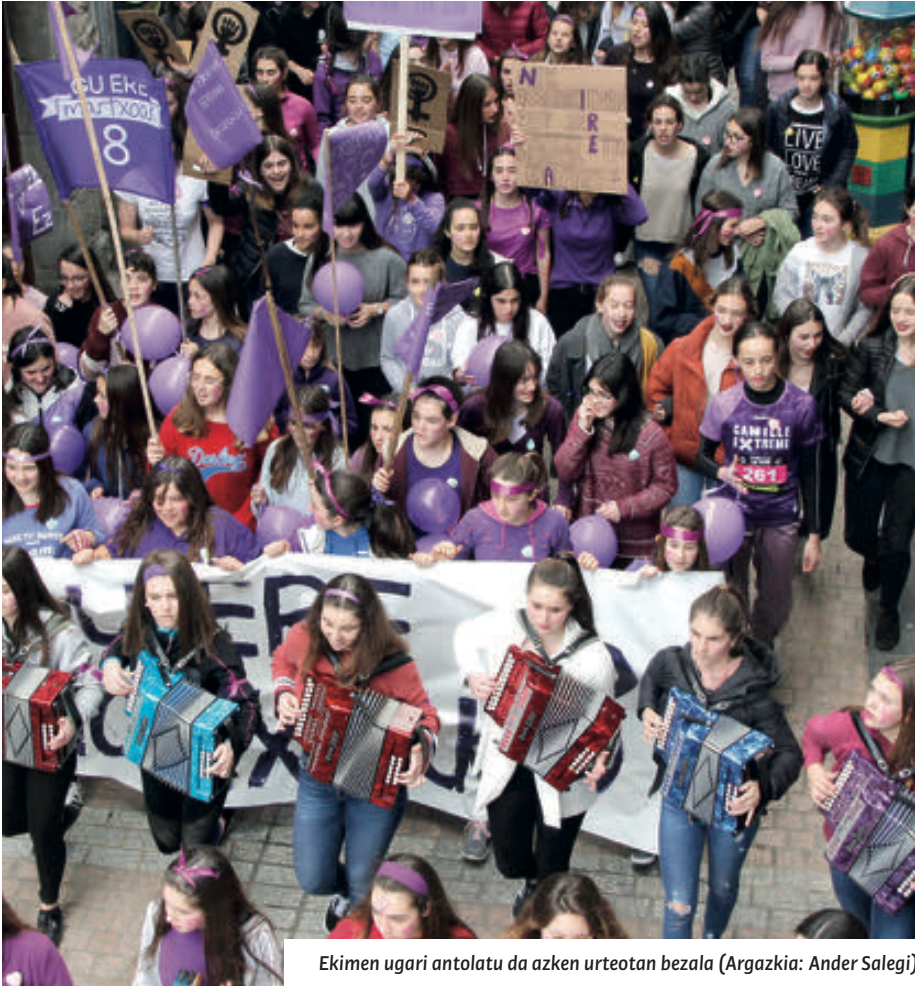
Ekimen ugari antolatu da azken urteotan bezala.