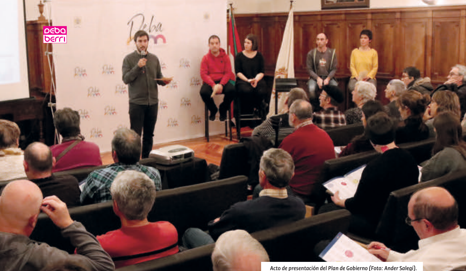
Acto de presentación del Plan de Gobierno.