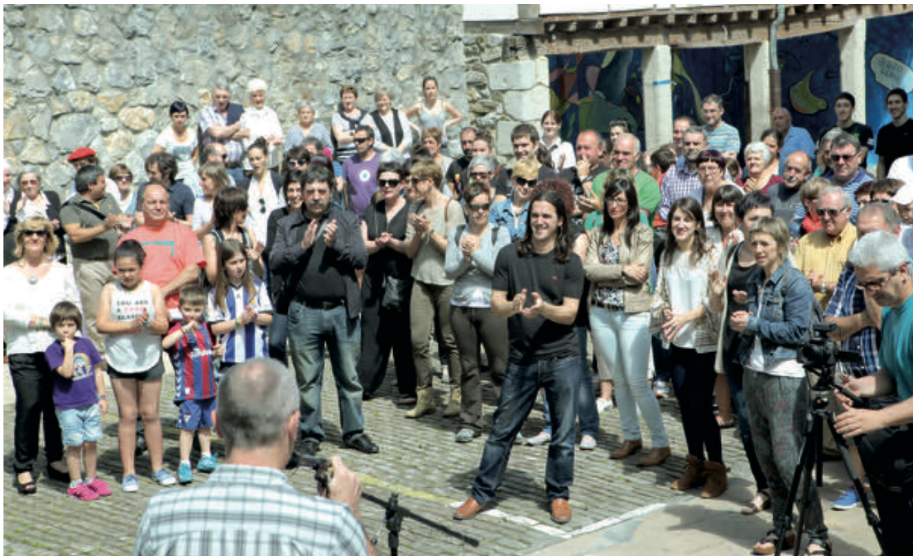
2015eko ekainaren 20an egin zen lehen aurkezpena.

Dagoeneko bost urte beteak ditu Itziarko Auzo Udalak, 2014ko otsailaren 27an ofizialki eratu zenetik. Urtearen sasoi honetan ospatu izan du urteurrena jendartean harrezkero, egindako bidearen balioa gogora ekarriz. Bosgarrena zenbaki biribila da, esanahi bereziz jantzia. Gatazka, aurreiritzi eta gaizki ulertuak gainditzeko bidean, aurrera doa Itziarko Auzo Udala.