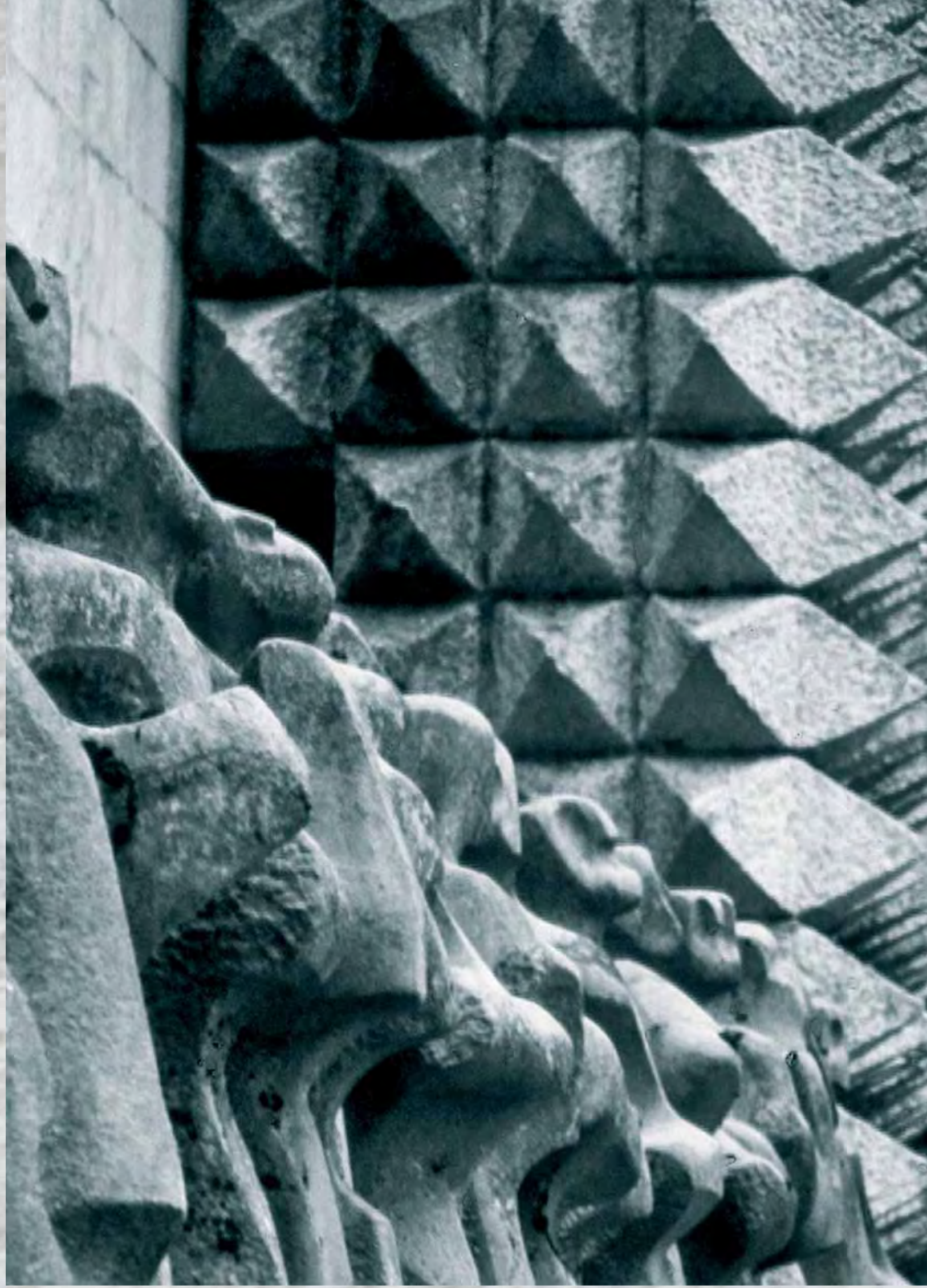
Sanctuary of Arantzazu - Sanctuaire d'Arantzazu

Jusque dans les années cinquante, les carrières d'Arronamendi, aujourd'hui disparues, et qui étaient situées sur les falaises du Géoparc de la Côte Basque, accueillirent un total de six entreprises d'exploitation de grès à ciment argileux utilisés dans la fabrication des briques. On raconte que dans les années trente, plus d'une centaine de personnes travaillaient dans la carrière d'Arronamendi.