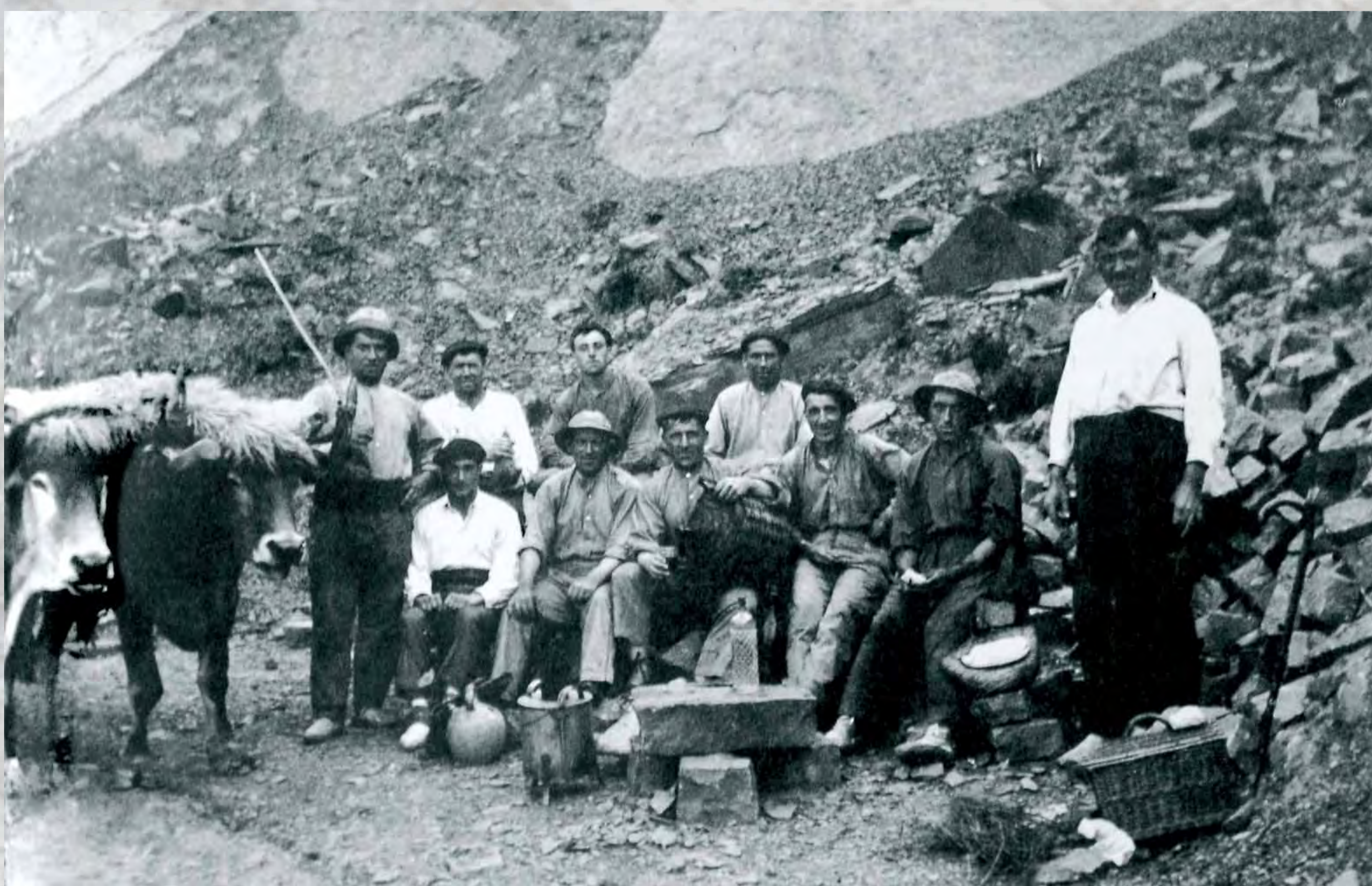
The Arronamendi quarries (1925) - Les carrières d'Arronamendi (1.925)