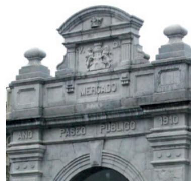
Escudo de Deba, situado en el frontón de la portada de entrada principal al paseo cubierto timbrado con corona ducal, como ejemplo de los colocados en edificios civiles municipales. Enero 2003.

Este escudo municipal, con mínimas variantes en sus figuras heráldicas y adornos, se han utilizado y utilizan por el Ayuntamiento, además del sello de bronce y las piedras areniscas citadas, en distintos soportes como son ejemplo: en hierro fundido; en vidriera emplomada, encima de la puerta de entrada al claustro por la iglesia de Santa María; en madera, en el reposacabezas del sillón del alcalde y detrás en el zócalo; bordados en la tela, en las banderas que usa el municipio para actos especiales, en placas de bronce; en piedra caliza, en los edificios municipales; en todo tipo de papel y en los sellos caucho usados por distintas dependencias municipales.