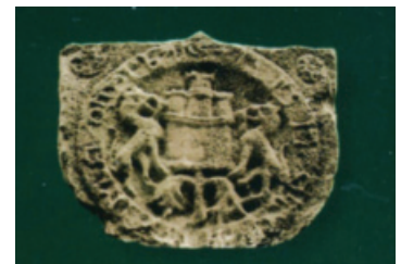
Escudo labrado en piedra arenisca de la villa de Deba, situado en la cornisa de la fachada de la iglesia matriz de Santa María en el casco histórico, representando al municipio como patrono merelego que es de ella.

En un documento de reconocimiento y declaración fechado el 9 de setiembre 1772, por orden de la Cámara de Castilla, se hace un cotejo entre la piedra armera existente en la cornisa de la fachada principal de la iglesia de Santa María de la villa y el «sello» de bronce utilizado en aquellas fechas para sellar las cartas, despachos y otros afines, por parte del Ayuntamiento. Se llega a la conclusión que ambos son en campo circular e iguales en cuanto a blasones. El de bronce lleva «un castillo sobre rocas y a sus lados dos leones que parecen quieren asaltarse y llega en ambos una de sus manos a hacer presa del borde de las almenas», estando los leones «hechos a buril con bastante perfección, distinguiéndose la lengua, boca, pelos, crin, colas y los flancos de sus ancas».