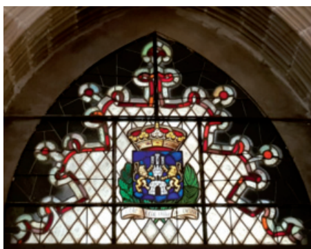
Escudo de Deba en vidriera emplomada cubriendo el espacio del arco de entrada, encima de las puertas, que dan acceso al claustro desde la nave central de la iglesia de Santa María. Julio 2013.

Con fecha posterior, la mejor representación plástica del escudo de la villa de Deba está en la fachada principal de la Casa Consistorial, formando una terna horizontal entre dos huecos cerrados con puertas y balconadas, centrado con el escudo imperial de mayores dimensiones, el de Gipuzkoa a su derecha y a su izquierda el de Deba. Fueron esculpidos en piedra arenisca por Lucas Longa, entre 1685 y 1691 año, este último, cuando se le finiquitó con 100 pesos, estando ya «fijadas en el frontispicio de la casa concejil de ella.» El de Deba, está formado por tres piezas rectangulares colocadas una encima de la otra creando una composición propia de la época. Está timbrado con corona ducal que simulan sostener dos amores, uno a cada lado. Rodean la cartela por encima y por debajo sendos mascarones y nacen por sus lados lambrequines y sobre ella, en campo apuntado las siguientes armas: Un castillo donjonado con tres torrecillas, la central más alta que las otras dos, sobre la que puede ser una mata con sus ramas, con sendos leones rampantes leopardados o mirando al frente, uno a cada lado.