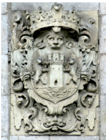
Escudo de Deba, situado en la fachada principal de la Casa Consistorial, el de su izquierda de los tres que componen el conjunto. Julio 2004.