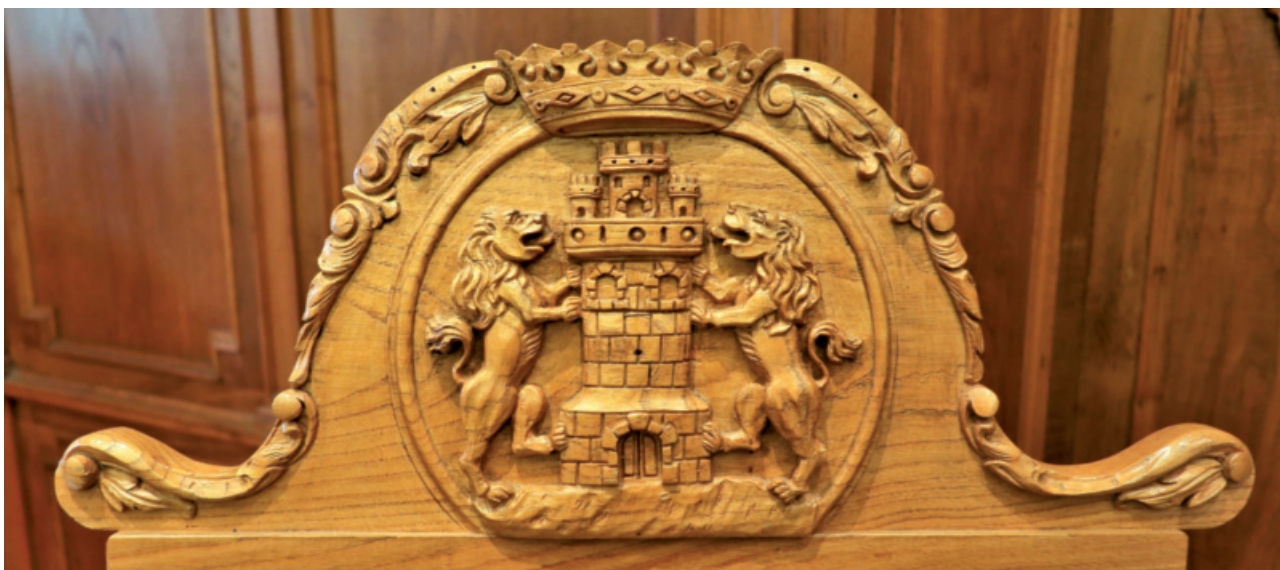
Escudo de madera de Deba, en el reposa cabezas de la butaca presidencial en la sala capitular de la Casa Consistorial. Diciembre 2018.

Este escudo municipal, con mínimas variantes en sus figuras heráldicas y adornos, se han utilizado y utilizan por el Ayuntamiento, además del sello de bronce y las piedras areniscas citadas, en distintos soportes como son ejemplo: en hierro fundido; en vidriera emplomada, encima de la puerta de entrada al claustro por la iglesia de Santa María; en madera, en el reposacabezas del sillón del alcalde y detrás en el zócalo; bordados en la tela, en las banderas que usa el municipio para actos especiales, en placas de bronce; en piedra caliza, en los edificios municipales; en todo tipo de papel y en los sellos caucho usados por distintas dependencias municipales.