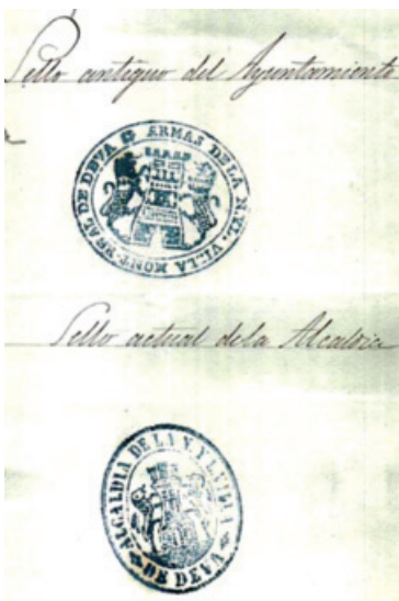
Sellos de las armas de la villa de Deba. El de arriba el antiguo y el de abajo el actual, en el año 1876.

En la piedra armera «hay en medio un castillo, aunque no se distinguen rocas en su planta, sino una especie de mata, donde las ramas caen igualmente a ambos lados, y son mayores que el tronco del medio, sirve de basa o peana a los leones, que están en la misma acción de asaltar el castillo y llega a ambos una de sus manos a hacer presa del borde de las almenas». Aunque no se define la inscripción que bordea el escudo de armas de la cornisa, un anticuario por encargo del Cabildo leyó tres veces uniformemente la siguiente inscripción: «Estas son las armas de la villa».