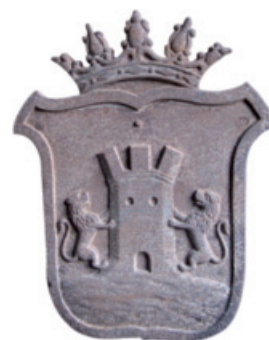
Escudo de hierro fundido de la villa de Deba, existente en locales municipales. Febrero 2012.