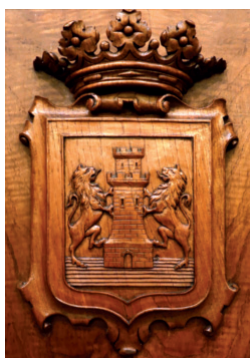
Escudo de madera de Deba, en forrado del mismo material, detrás de donde se sienta la presidencia, en la sala de capitular de la Casa Consistorial. Diciembre 2018.