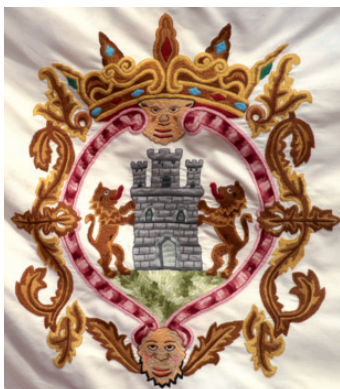
Escudo bordado en tela de Deba, en una de las banderas que hay en la Casa Consistorial. Diciembre 2018.