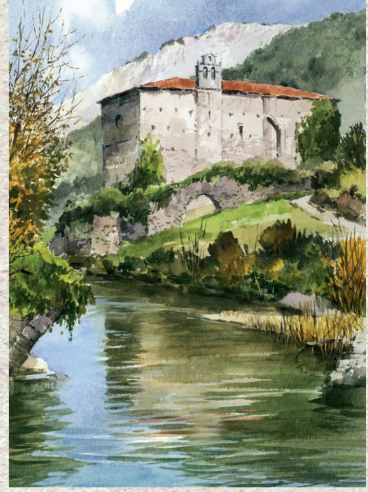
Sasiolako ospitale-komentua. Convento hospital de Sasiola.

Debatik pasa ondoren, Markinan amaitu zuen bere etapa. Han, Juan Antonio Mogel apaiza, idazlea eta hizkuntzalari ezagutu eta haren lagun handia egin zen.