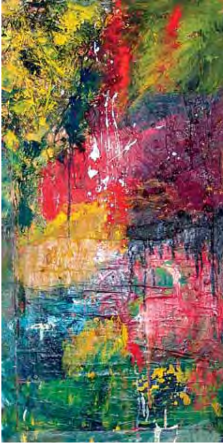
Izura Teknika mistoa zuran / Técnica mixta sobre madera / Technique mixte sur bois 124 x 62 cm - 2016