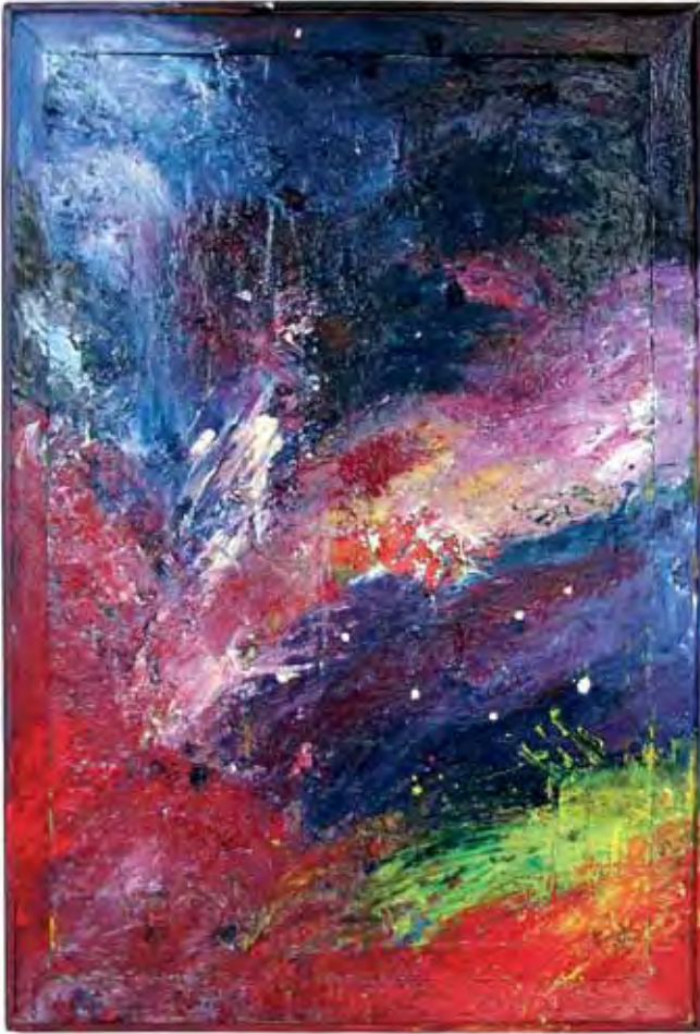
Ilunabar / Crepúsculo / Crépuscule Olio zuran / Óleo sobre madeira / Huile sur bois 111 x 79 cm - 2018