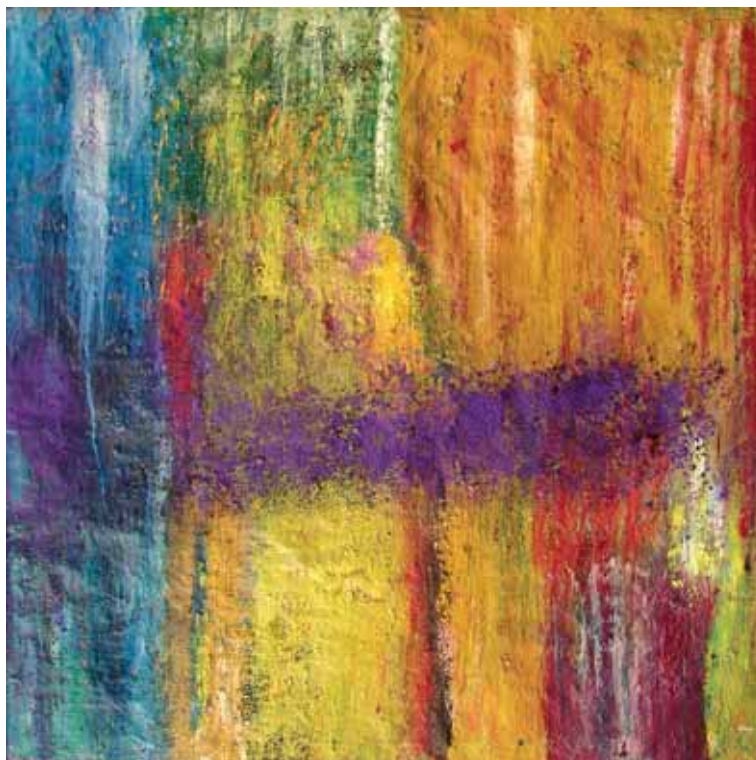
Izenbururik gabe / Sin título / Sans titre Olio eta pigmentuak mihisean / Óleo y pigmentos sobre lienzo / Huile et pigments sur toile 100 x 100 cm - 2016