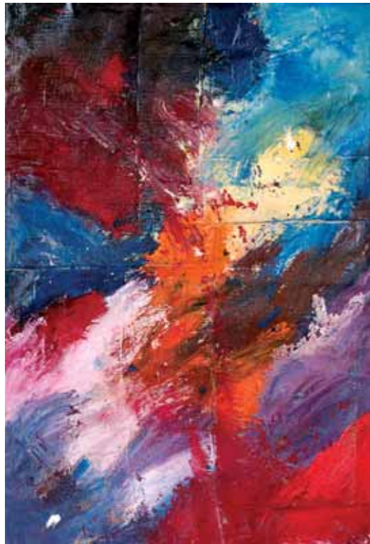
Izenbururik gabe / Sin título / Sans titre Olio mihisean kartoi gainean kolatuta / Óleo sobre lienzo encolado sobre cartón / Huile sur toile collée sur carton 156 x 113 cm - 2018