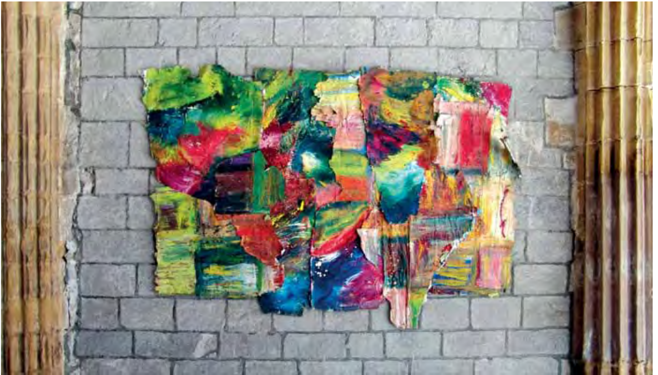
Izenbururik gabe / Sin título / Sans titre Olio erazutako kartelen gainean / Óleo sobre carteles arrancados / Huile sur affiches arrachées 2018