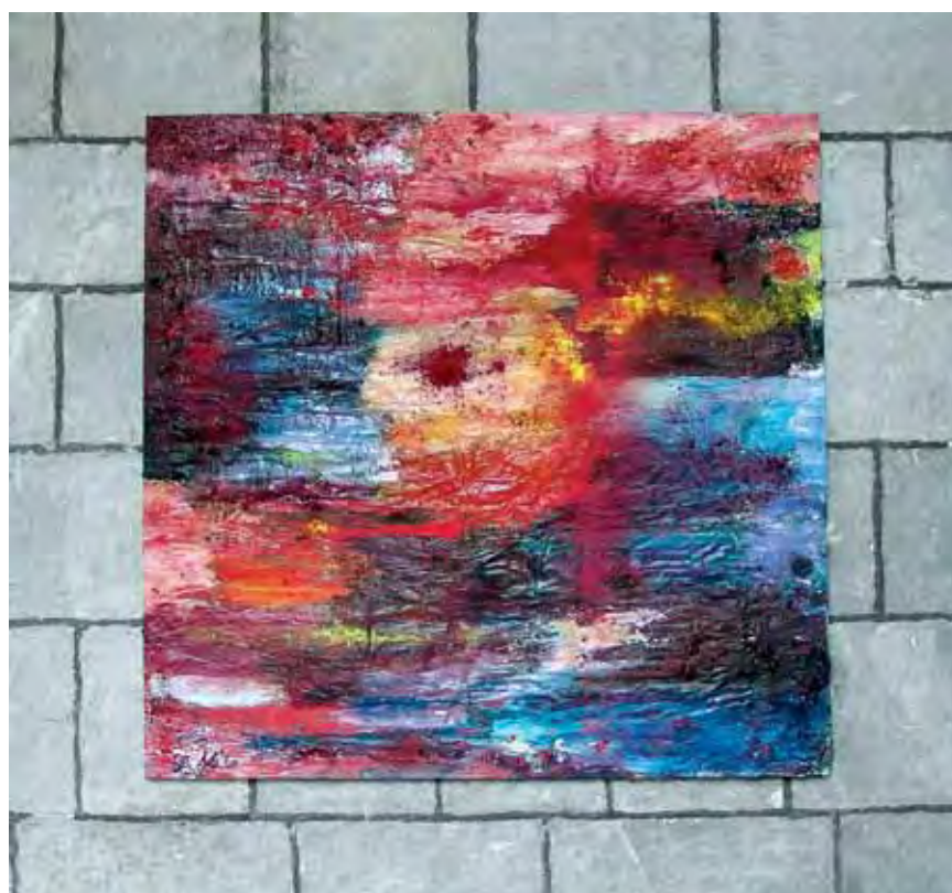
Negua / Invierno / Hiver Teknika mistoa / Técnica mixta / Technique mixte 150 x 150 cm - 2018