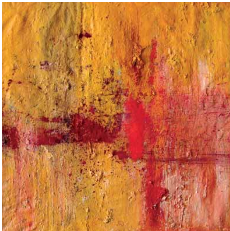
Izenbururik gabe / Sin título / Sans titre Olío eta pigmentuak mihisean / Óleo y pigmentos sobre lienzo / Huile et pigments sur toile 90 x 90 cm - 2016