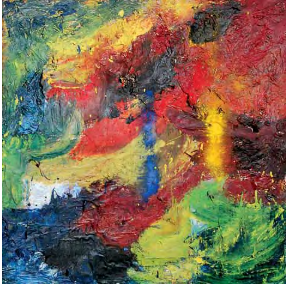
Udaberria / Primavera / Printemps Teknika mistoa zuran / Técnica mixta sobre madera / Technique mixte sur bois 120 x 120 cm - 2017