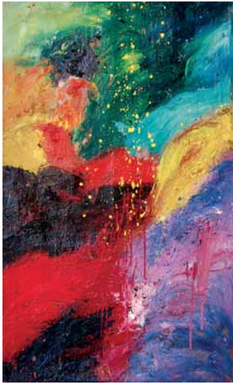
Izenbururik gabe / Sin título / Sans titre Olio mihisean / Óleo sobre lienzo / Huile sur toile 148 x 91 cm - 2018