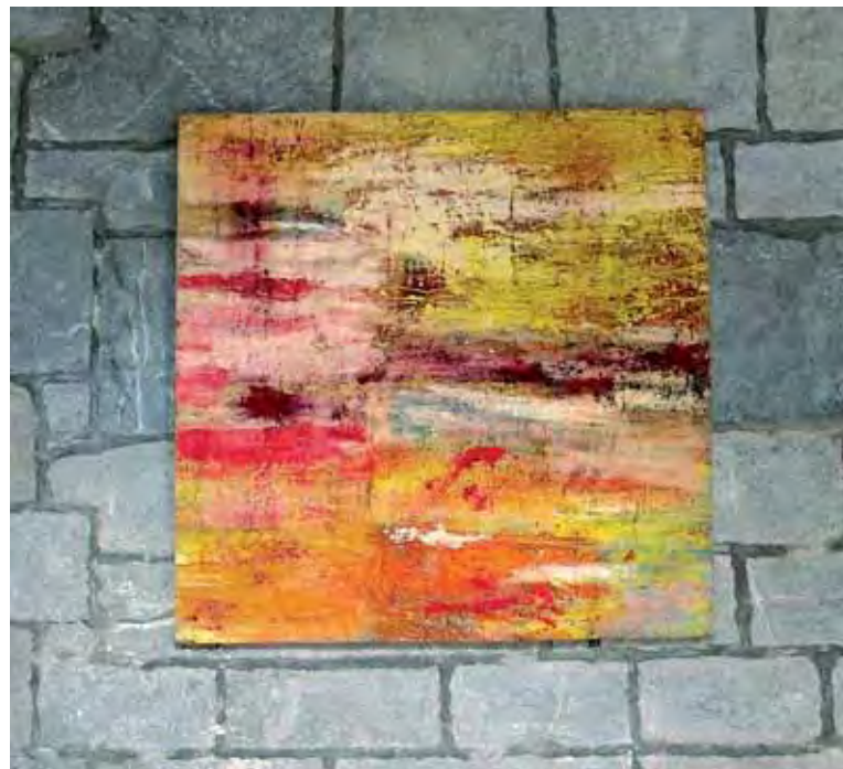
Izenbururik gabe / Sin título / Sans titre Olio eta pigmentuak erauzitako kartelen gainean / Óleo y pigmentos sobre carteles arrancados / Huile et pigments sur affiches arrachées 120 x 120 cm - 2018