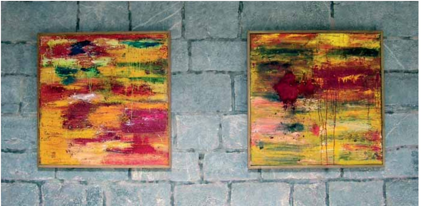
Izenbururik gabe / Sin título / Sans titre Olio eta pigmentuak mihisean / Óleo y pigmentos sobre lienzo / Huile et pigments sur toile 100 x 100 cm - 2016