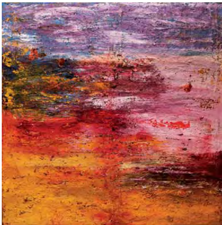
Izenbururik gabe / Sin título / Sans titre Olio eta pigmentuak mihisean / Óleo y pigmentos sobre lienzo / Huile et pigments sur toile 100 x 100 cm - 2016