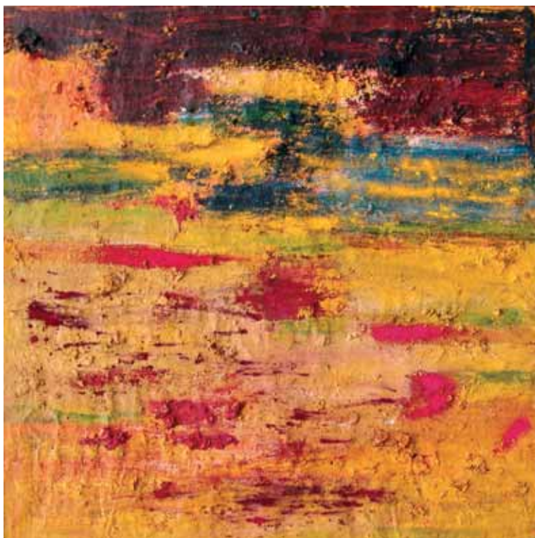
Izenbururik gabe / Sin título / Sans titre Olío eta pigmentuak mihisean / Óleo y pigmentos sobre lienzo / Huile et pigments sur toile 100 x 100 cm - 2016