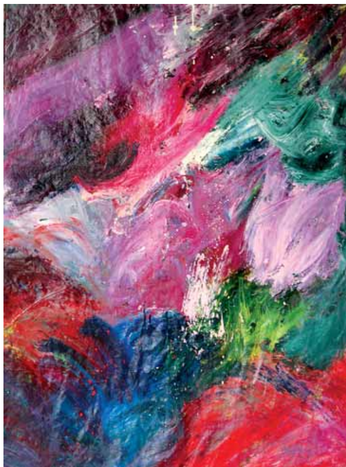
Udazkena / Otoño / Automne Olio mihisean / Óleo sobre lienzo / Huile sur toile 162 x 130 cm - 2018