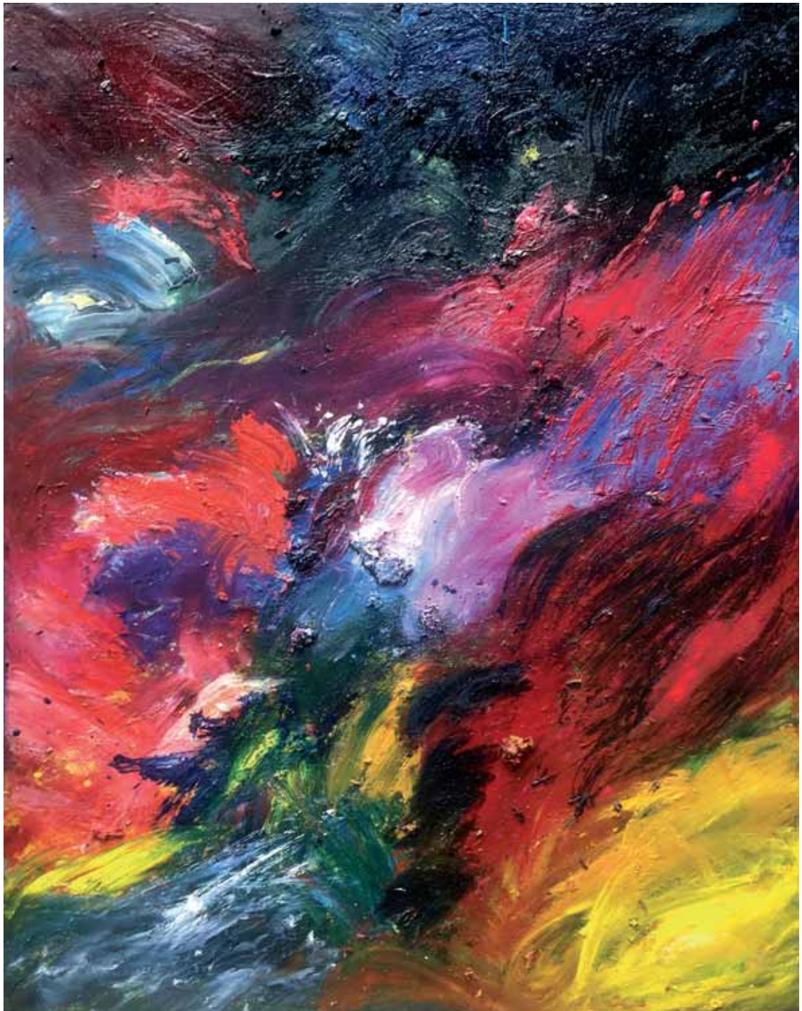
Ilunpea / Tinieblas / Ténèbres Olio eta pigmentuak mihisean / Óleo y pigmentos sobre tela / Huile et pigments sur toile 162 x 130 cm - 2018