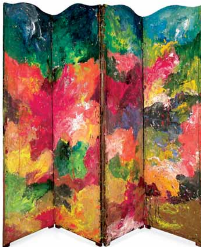
Amaginarrebaren bionboa / El biombo de la suegra / Le paravent de la belle-mère Teknika mistoa / Técnica mixta / Technique mixte Neurri aldakorak - Medidas variables - Dimensions variables 2018