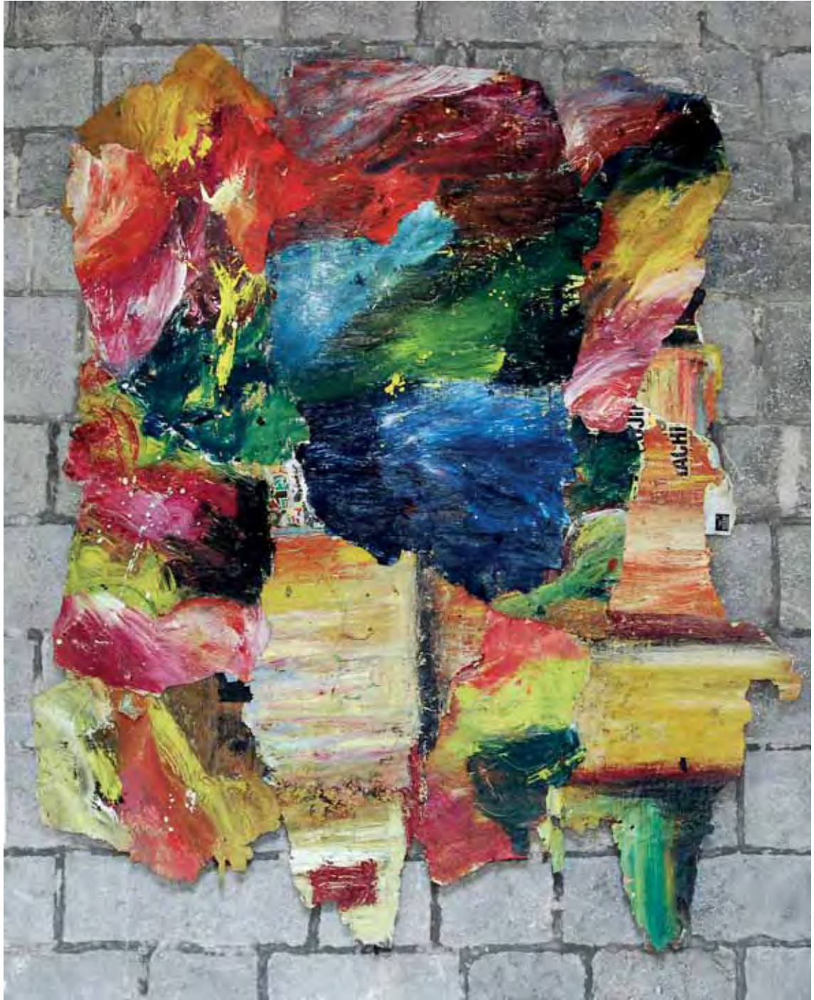
Izenbururik gabe / Sin título / Sans titre Olio erauzitako kartelen gainean / Óleo sobre carteles arrancados / Huile sur affiches arrachées 2018