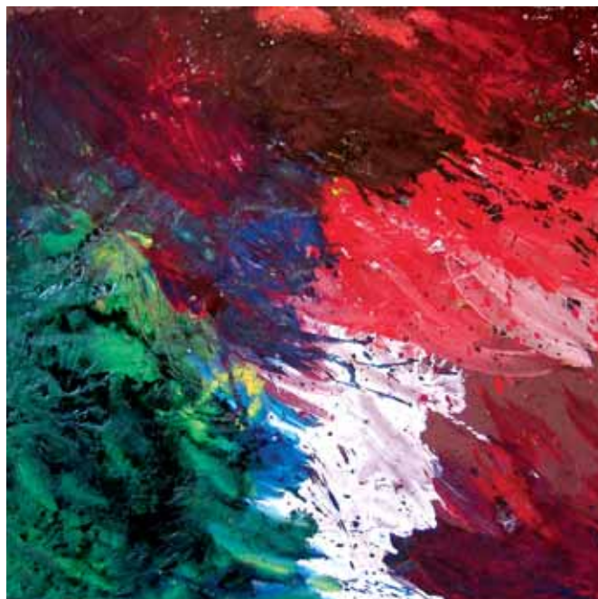
Ekaitza / Tormenta / Orage Kolatutako paperean egindako akrilikoa, oihal gainean / Acrílico sobre papel encolado sobre tela / Acrylique sur papier marouflé sur toile 112 x 112 cm - 2018