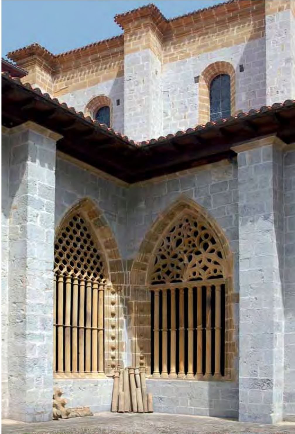
Debako Santa Maria elizako klaustroa Claustro de la iglesia de Santa María de Deba Cloître de l'église de Santa María de Deba

2018ko uztaila - abuztua julio - agosto de 2018 juillet - août 2018