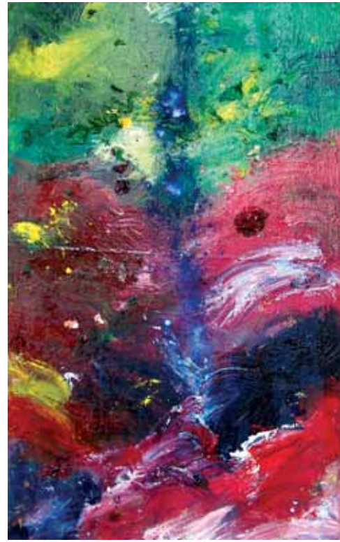
Izenbururik gabe / Sin título / Sans titre Olio eta pigmentuak mihisean / Óleo y pigmentos sobre lienzo / Huile et pigments sur toile 148 x 91 cm - 2018