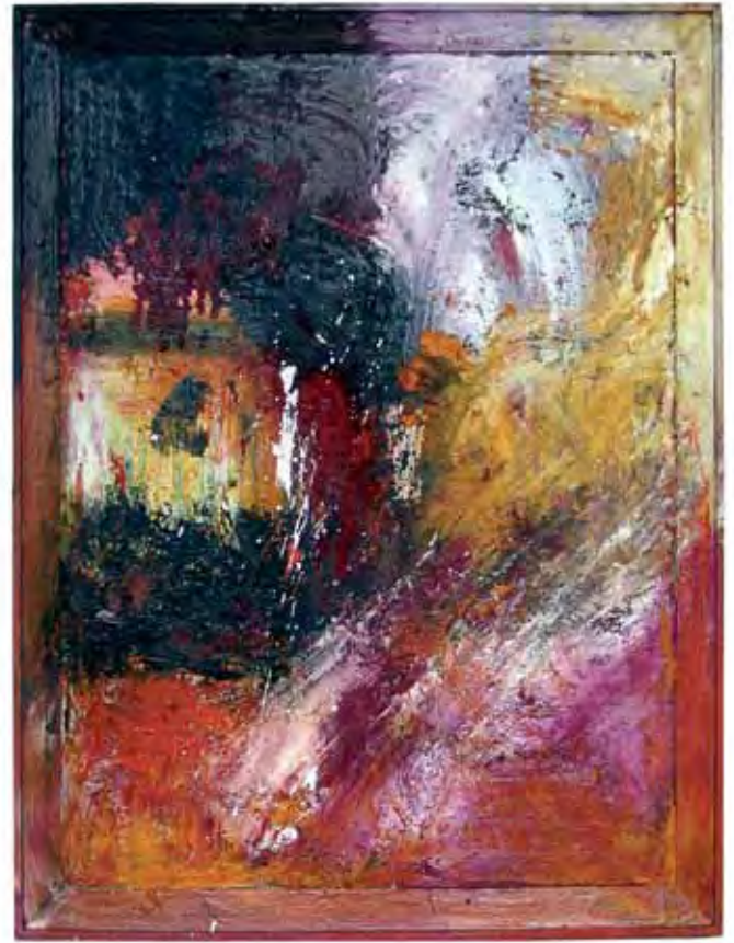
Peikonia Olio zuran / Óleo sobre madeira / Huile sur bois 98 x 78 cm - 2018