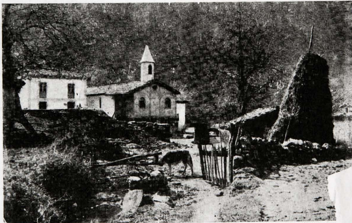
DEVA.—Vista de San Nicolás de Lastur.