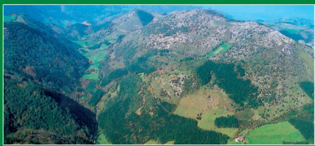
Lastur Haranaren bista orokorra Gaztelu menditik.

Ziurrenik, betizu-talde bat bazkan ikusteko ere aukera izango dugu, Lastur Haranerantz goazela.