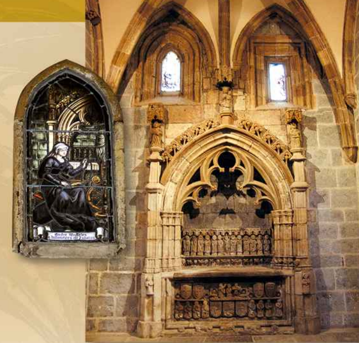
Zubeltzu leinuaren kapera, "Irulearen kapera" izenarekin ezagutzen dena. Beirateetako baten xehetasuna.

Hilobiratzeko kapera horietako bakoitza monumentu bat da. Elizaren hasierako proiektuan ez zeuden aurreikusita; geroagoko aldaketa izan zen, beraz.