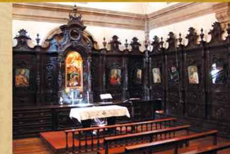
Sakristiaren zati bat.

Ebanjelioaren aldean dagoena Errosarioko Amari eskainia da. Horren buruan Ama Birjinaren irudia dago, eta alboetan Limako Santa Rosaren eta Nortziako Santa Ritaren irudiak. Bigarren solairuan, San Joan Bataiatzailea, San Agustin eta San Bartolomearen irudiak daude; eta atikoan, Paduako San Antonioren irudia. Epistolako aldean dagoen erretaularen burua San Migel arkanjeluari eskainia dago, eta alboetan San Buenaventuraren eta Avilako Santa Teresaren irudiak daude. Gainerako tarteetan, Santa Katalinaren eta San Tomasaren irudiak ikus daitezke eta, goieneko aldean, Santa Isabel Erreginarena.