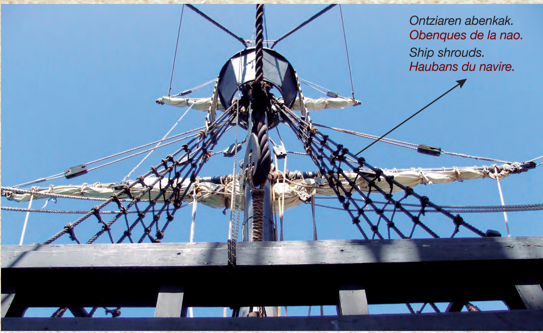
Ontziaren abenkak. Obenques de la nao. Ship shrouds. Haubans du navire.