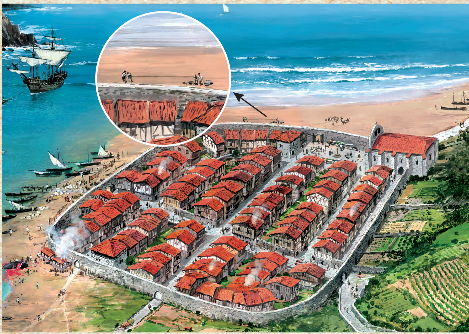
Egungo Sokagin kalea haresiaren aldamenean geratzen zen, baina kanpoaldean. Berez, orain zauden lekuan bertan egiten zituzten Debako sokagileek ontzietarako sokak. La actual calle Cordelería, donde te encuentras, se situaba pegada a la muralla pero fuera de ella y era el lugar donde los cordeleros elaboraban las cuerdas para sus navas. The current Rope street, where you are located, was located next to the wall but outside of it, and was the place where the rope makers made the ropes for their ships. L'actuelle rue de la Corderie, où vous vous trouvez, était située près de la muraille mais en dehors de celle-ci. C'était l'endroit où les cordiers fabriquaient les cordes pour leurs navires.

Desde la fundación de Montreal de Deva en 1343, su historia estuvo ligada al mar, más concretamente a la navegación comercial, a la pesca y a la caza de la ballena.