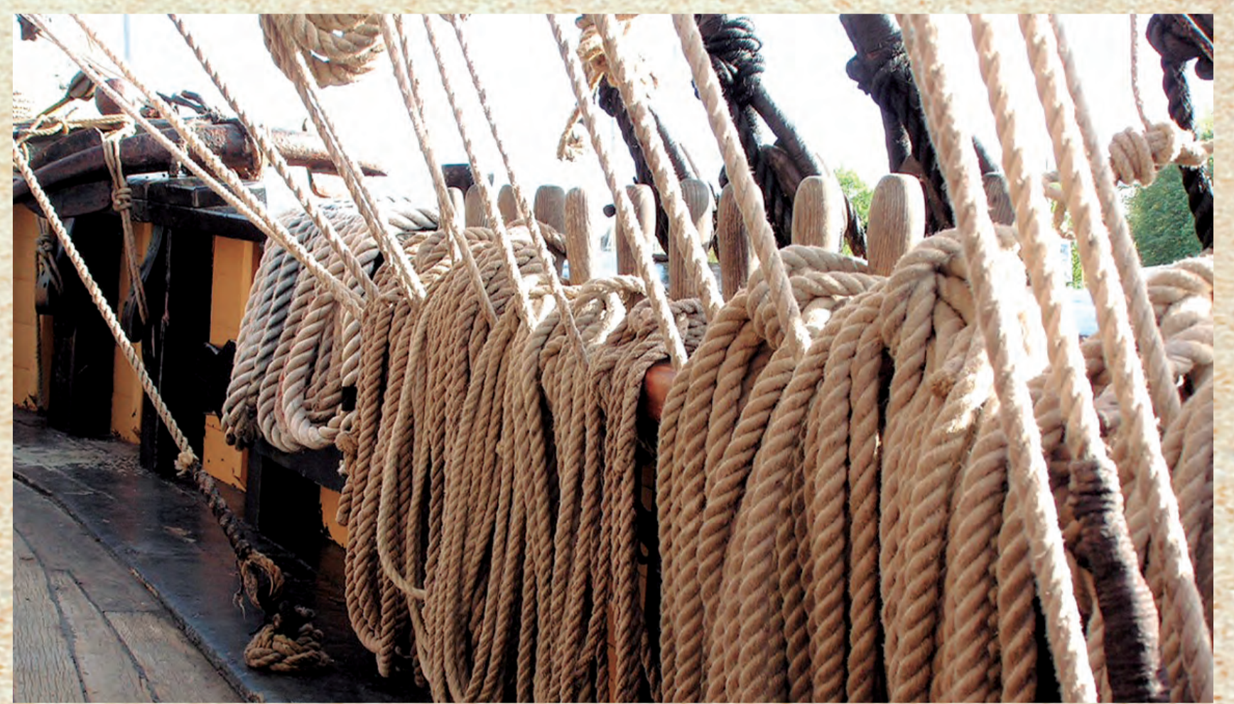
Soka hitzak "suka" termino zeltikoan izan dezake jatorria. Nolanahi ere, euskal kulturari oso lotua dago: sokatira, sokamuturra, sokadantza... La palabra "soka" ("soga" en castellano) podría tener su origen en el término céltico "suka". En cualquier caso, está muy ligada a la cultura vasca: sokatira, sokamuturra, sokadantza... The word "soka" (rope in English) may have its origin in the Celtic term "suka". In any case, it is closely linked to The Basque culture: sokatira, sokamuturra, sokadantza... Le mot "soka" (corde en français) peut avoir son origine dans le terme celtique "suka". En tout cas, il est étroitement lié à la culture basque: sokatira, sokamuturra, sokadantza...

Un vaste espace était nécessaire pour la fabrication des cordes. C'est précisément pour cette raison que ce travail était effectué à l'extérieur des remparts de la ville; à savoir sur le sable.