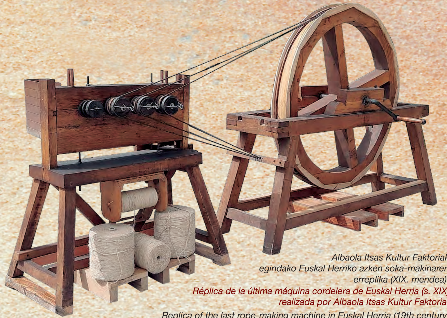
Albaola Itsas Kultur Faktoriak egindako Euskal Herriko azken soka-makinaren erreplika (XIX. mendea). Réplica de la última máquina cordelera de Euskal Herria (s. XIX) realizada por Albaola Itsas Kultur Faktoria. Replica of the last rope-making machine in Euskal Herria (19th century) made by Albaola Itsas Kultur Faktoria.

Sokak egiteko toki zabala behar zen. Horregatik, hiribilduko hesi edo harresietatik kanpo egiten zen lan hori; hau da, hareatzan.