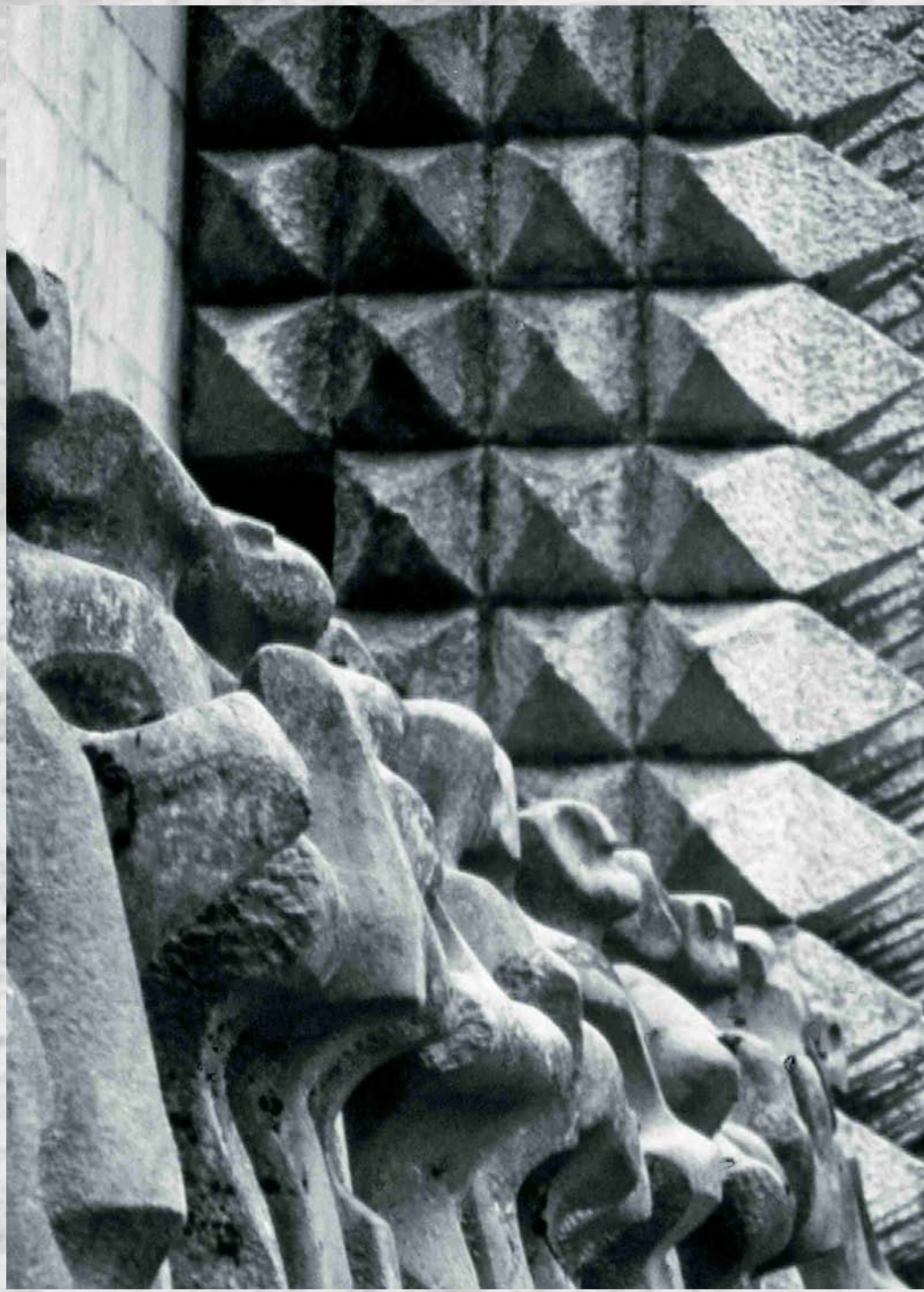
Arantzazuko santutegia - Santuario de Arantzazu

Hasta los años cincuenta del siglo veinte, las ya desaparecidas canteras de Arronamendi, situadas en los acantilados costeros del Geoparque de la Costa Vasca, albergaron hasta seis empresas explotadoras de piedra arenisca calcárea destinada a la elaboración de adoquines. Según se dice, durante los años treinta del siglo XX, en la cantera de Arronamendi trabajaron hasta cien personas.