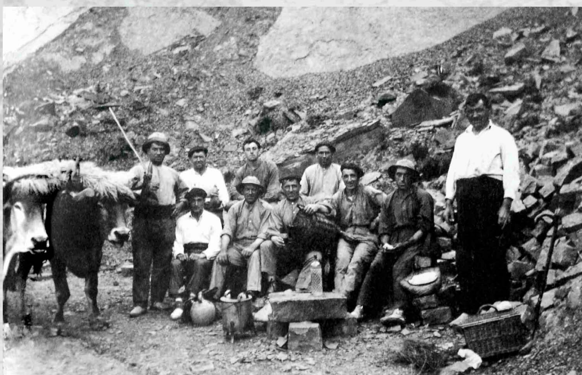
Arronamendiko kantera, 1925 aldian - Cantera de Arronamendi, hacia 1.925