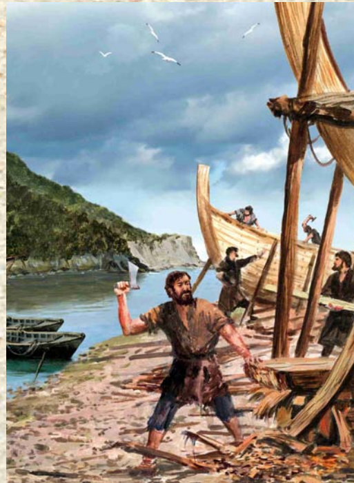
Hiribilduko ontziolak - Astilleros de la villa

La quinta puerta era popularmente conocida como "Portal del Astillero", por dar acceso a la zona ribereña, donde se encontraban los astilleros de la villa. Junto a este portal se encontraban los hornos para la fundición de la grasa de las ballenas cazadas, una zona conocida como "Labatai" (labe-atea, portal del horno).