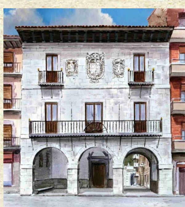
Udaletxea / Ayuntamiento

Arkupean, hareharriko bi armari daude, antzinako Oliden eta Irarrazabal familienak.