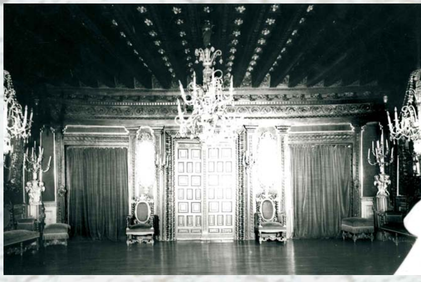
Ispiluen Gela - Salón de los Espejos

Anteriormente, en 1866, el palacio de Aguirre había recibido la visita de la reina Isabel II y de su esposo Francisco de Asís, a quienes acompañaban sus hijos Alfonso (futuro Alfonso XII) y la infanta Doña Isabel.