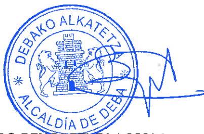
PEDRO BENGOETXEA LOIOLA DEBAKO ALKATEA ALCALDE DE DEBA