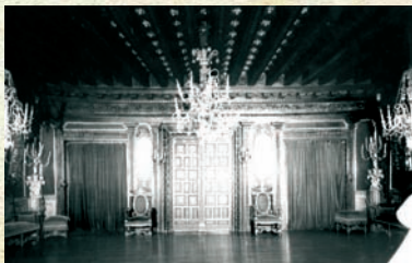
Ispiluen Gela - Salón de los Espejos

Otro episodio interesante en la historia del palacio de Aguirre sucedió durante la última Guerra Carlista, cuando a principios del mes de enero de 1875 el edificio se convirtió en Cuartel Real de Carlos VII.