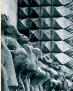
Arantzazuko santutegia Santuario de Arantzazu

Durante siglos, la extracción de la piedra ha representado el modo de vida y el sustento de numerosas familias del municipio.