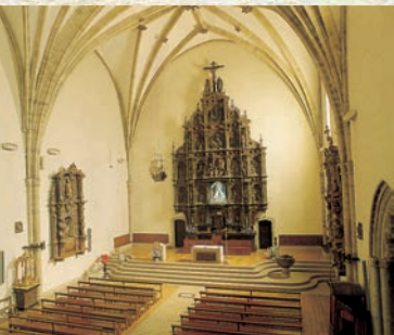
Tenpluaren barrualdea Interior del templo

Sobre esa construcción del siglo XIV, se levantó en el siglo XVI el actual templo, más alto, con contrafuertes y con bóvedas de crucería.