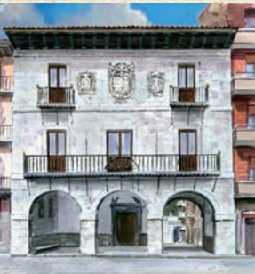
Udaletxea / Ayuntamiento