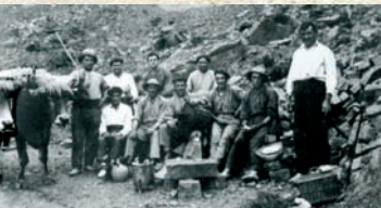
Arronamendiko kantera, 1925 aldera Cantera de Arronamendi, hacia 1.925

Mendeetan, udalerriko familia askoren bizi-modua eta ogibidea harria ateratzea izan da. Asko izan dira historian zehar Deban ustiatu izan diren harrobiak. Gehienak kareharrizkoak izan dira; baina, bere garaian oso garrantzi-tsuak izan ziren, baita ere, kare hareharrien harrobiak, galtzadarriak egiteko erabiltzen zirenak.