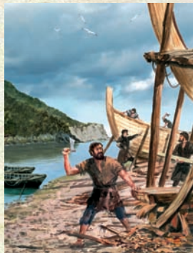
Hiribilduko ontziolak Astilleros de la villa

Asentada sobre un antiguo campo de dunas del estuario del río Deba, la nueva villa fue rodeada por una cerca o muralla que contaba con cinco puertas: “Portal de la Fuente”, el acceso natural a la primitiva fuente pública; “Portal del Pasaje”, por dar salida al puerto; “Portal del Arenal”, acceso al amplio arenal (actual alameda de Calbetón); “Portal del Rey”, entrada a la población del camino real, tanto el que llegaba de Itziar como el que llegaba de Elgoibar; y el “Portal del Astillero”, acceso a la zona ribereña, donde se encontraban los astilleros de la villa. Junto a este portal se encontraban los hornos para la fundición de la grasa de las ballenas cazadas, una zona conocida como “Labatai” (labe-atari), portal del horno.