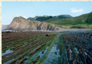
Sakonetako flyscha. Flysch de Sakoneta.

Situada sobre Deba, Santa Catalina es una verdadera atalaya natural desde la que se divisa una gran parte de la costa vasca. Un mirador excepcional donde el maravilloso paisaje de la costa se une al paisaje cárstico del interior del Geoparque.